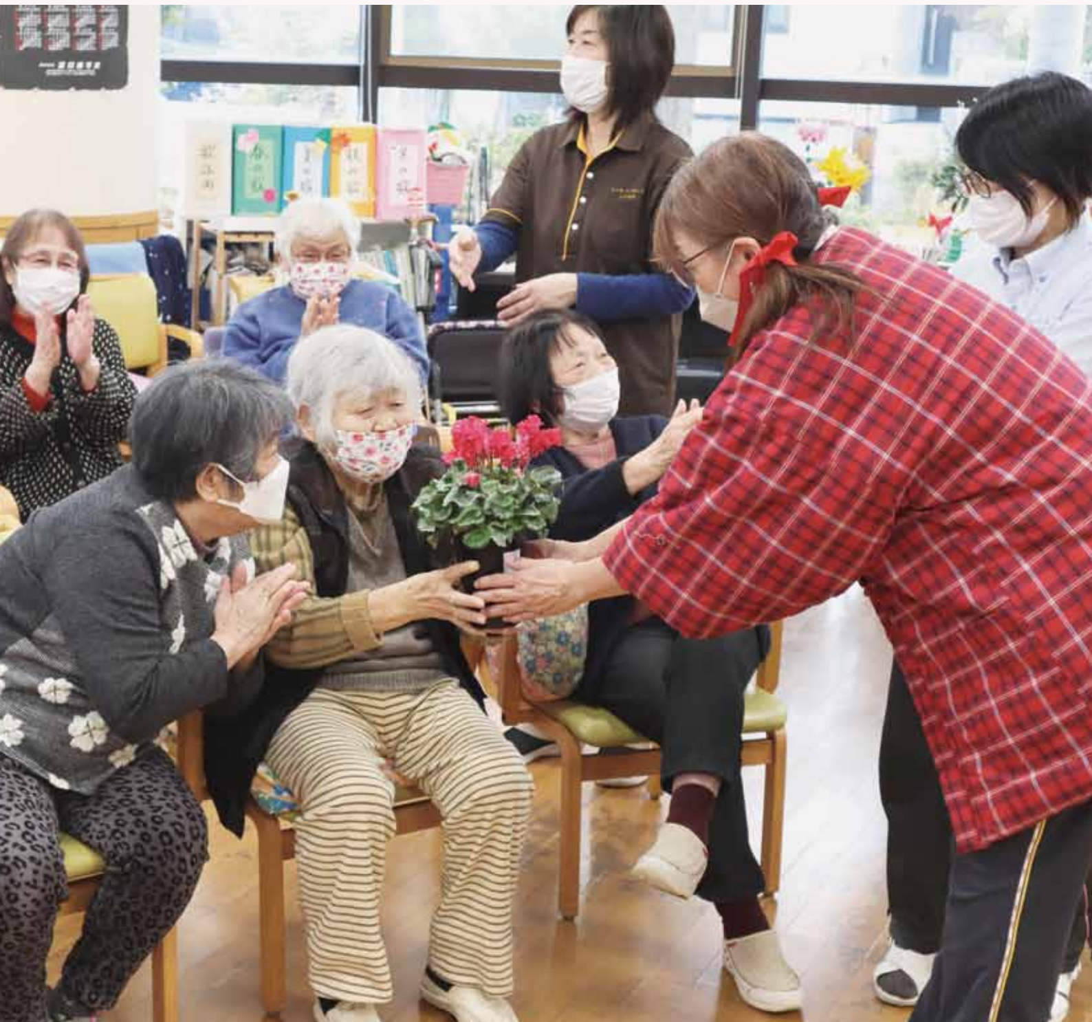
写真：デイサービスセンターしいの木 忘年会