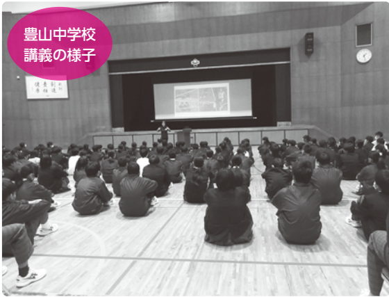
豊山中学校 講義の様子