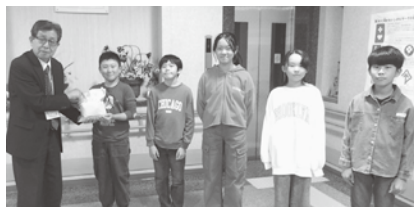
学校募金 新栄小学校