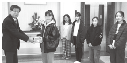
学校募金 志水小学校