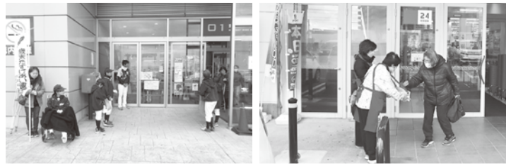
エアポートウォーク名古屋 12月7日 (豊山フェニックス少年野球クラブのご協力)